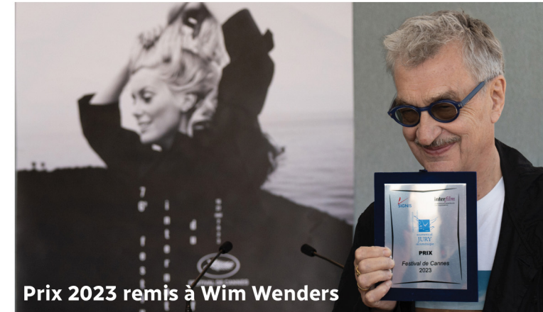
Prix 2023 remis à Wim Wenders

Le Jury choisit des films qui pourront être utilisés dans des ciné-clubs et groupes de discussion en vue de mieux comprendre et partager les défis et les espérances du monde contemporain.